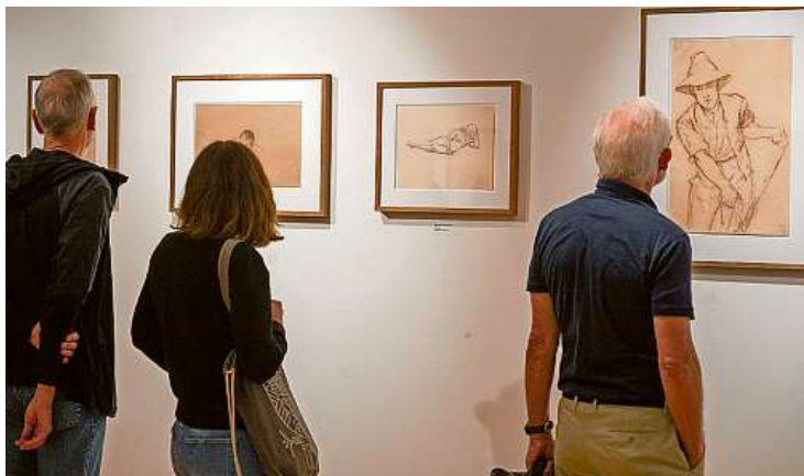
Die neue Sonderausstellung im Museum Vaz/Obervaz stösst auf grosses Interesse.