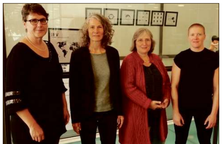
Responsablas dal teater Muntanellas han infurmà davart lur project

La Posta ha realisà in solid emprim mez onn 2017. La svieuta è bain sa reducida per 1,3% sin 4,09 milliardas francs. Il gudogn ha la Posta dentant savi augmentar tuttina per 81 milliuns sin 394 milliuns. Quai en emprima lingia pervi da la PostFinance. Quella part da la Posta ha realisà in meglier resultat sin il martgà da prestaziuns finanzialas. Ils uffizis postals e la vendita han nudà in deficit dad 88 milliuns francs.